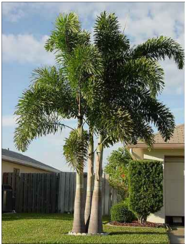
Palmeira Rabo de Raposa