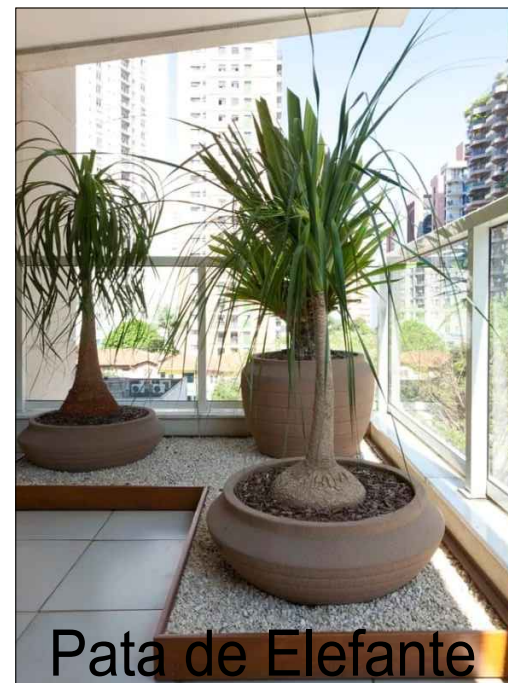
Pata de Elefante